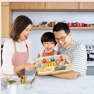
「盈御多元货币计划3」